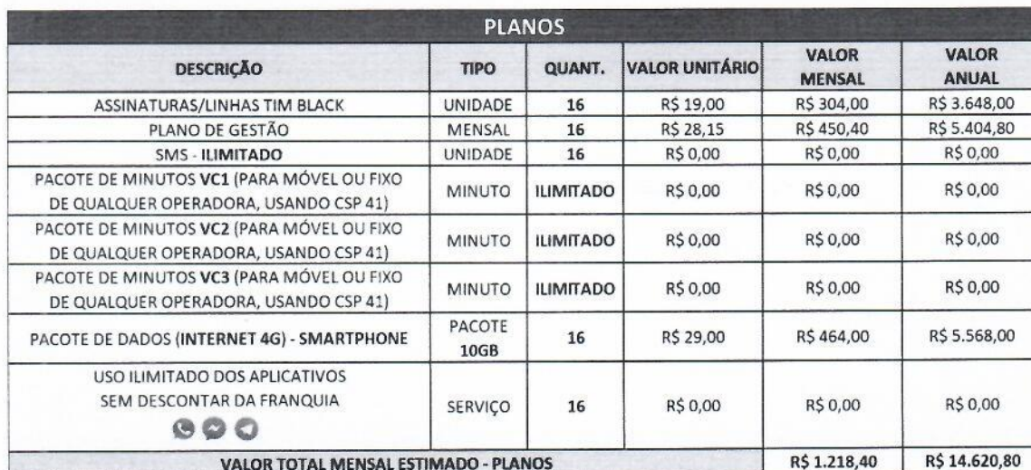
Tabela 1 – Serviço Móvel Pessoal

CLÁUSULA TERCEIRA - As demais cláusulas e condições estabelecidas no contrato originário, do qual este Termo Aditivo passa a ser parte integrante, permanecem inalteradas.